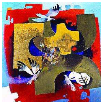
Arcabas - Trinité Eglise de St-Vincent de Paul de Grenoble

à 11 h office à la collégiale Saint-Pierre, à 18 h office à l'église Notre-Dame.